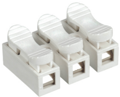
PTC-2P 823-2,5 PTC-3P 823-2,5