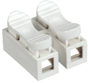
PTC-2P 823-1,5 PTC-3P 823-2,5